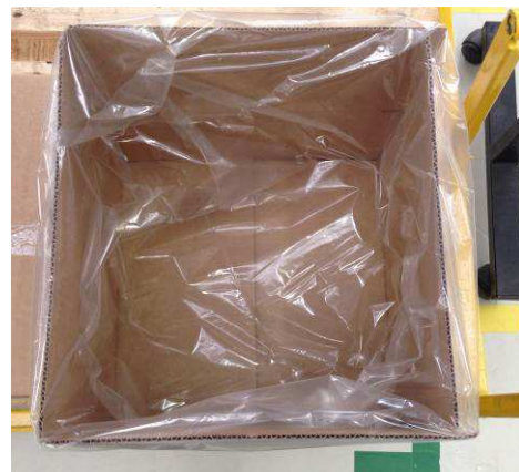
5.2 – Posicionar saco plástico PN 2133135-2.