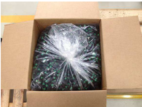
5.3 – Acomodar 2.000 peças e fechar saco plástico com cable tie PN 444316-1, conforme imagem acima.