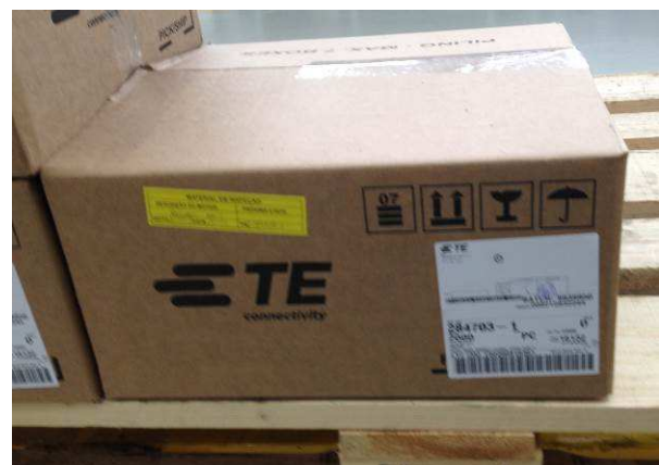
5.4 – Fechar caixa e colar etiqueta conforme imagem acima.