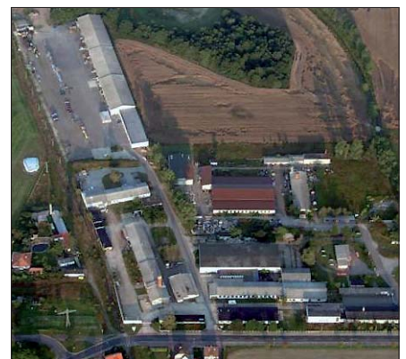
Tyco Electronics Raychem GmbH, Werk Falkenberg