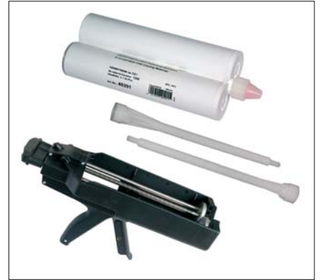
GURONIC C400-0 Doppelkartusche

Wir verstehen uns als Ihr kompetenter Dienstleister und Entwicklungspartner. Finden Sie in unserem Sortiment nicht das richtige Material? Wir bieten Ihnen auch die kundenspezifische Entwicklung und Harzformulierung an. Sie erhalten bei uns eine individuelle anwendungstechnische Beratung für Ihr spezielles Projekt.