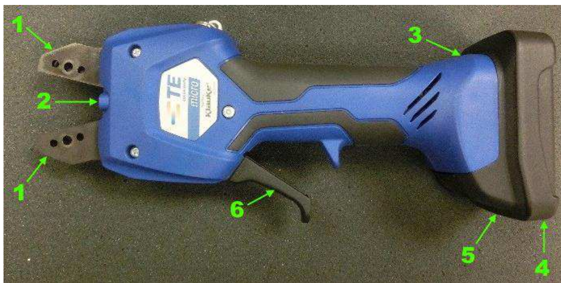
Figura 1: Kit utensile di aggraffatura con batteria installata

I kit dell'utensile di aggraffatura con alimentazione a batteria Micro SDE (Micro Standard Die Envelope) agli ioni di litio 2280380-[ ] si compongono di un utensile di aggraffatura a batteria e di una batteria ricaricabile (2280381-1) utilizzata per alimentare l'utensile. (Vedere la Figura 1.) I kit includono i caricabatterie (Tabella 1).