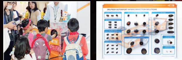
ブース正面にはTEオリジナルハローキティが当たるエアークイズ抽選会場、その奥にエコ関連製品や技術を紹介するコーナーを設置。

環境やエネルギーに関わる最新ソリューションが集結する「エコプロダクツ2015」が、昨年12月10～13日の日程で開催されました。TE Connectivityでは、CO 2 を出さない環境にやさしい自動車レースとして注目を集める電気自動車のF1「フォーミュラE」をはじめ、非接触接続技術「ARISO」や鉄道車両による環境負荷低減策など、最先端のエコ技術を体験型展示で紹介。人気の工作教室やクイズツアーも開催しました。当日は環境に関心のある親子連れや中高生のみなさんも多数来場されて、TE Connectivityのエコ技術を体感いただきました。